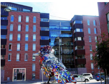
HASO Oy Poiju & Vallilan kiinteistöt Oy Leonkatu 20 (ATT) (julkaistu ARK 1/2013) Julius Jääskeläinen, projektiarkkitehti suunnitteluvaiheessa